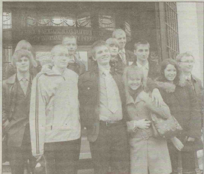
Министерство экономического развития и финансов.

Ни старшекласники, ни их родители не беспокоятся на счет будущей профессии. Ребята говорят, что если кто-то сейчас перестает работать на фондовом рынке, то это для того, чтобы ос-